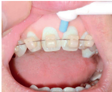
im Oberkiefer von oben.

SCHRITT 1 Mit der Munddusche das Grobe entfernen. Dabei immer den Wasserstrahl vom Zahnfleisch zum Zahn und nicht umgekehrt halten, damit man sich keine Bakterien in die Zahnfleischtaschen „schießt“.