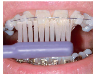
und dann die Kauflächen- bzw. Schneidekantenseite.