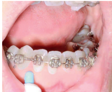
im Unterkiefer von unten.

SCHRITT 2 Aus Zahnpasta im Mund Schaum machen, damit die „Wurst“ nicht gleich wieder ins Waschbecken fällt.