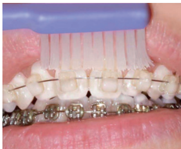
Erst die Zahnfleischseite der Klammer,...