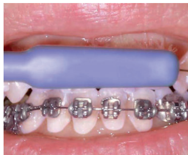
dann direkt die Klammer...